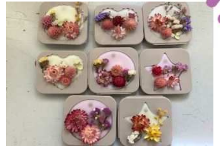
シリコン型に流し込みドライフ ラワーをのせる 固まったら型から外し完成