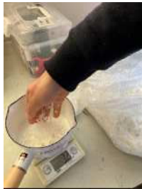
ろう ワックス(蠟)を計測