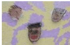
Jつかさ 「わたしたちのかお」