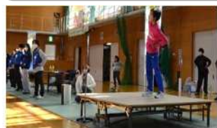
NPO法人アニマル体操クラブ