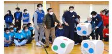
豊田地域看護専門学校の皆さん