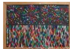
Jたかおか生活介護 「おいでんまつり花火大会マフラー」