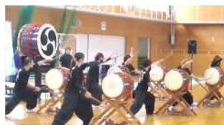
早川流やぐら太鼓保存会