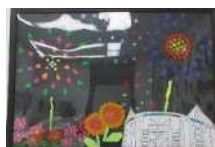
Jみさと 「われらの豊田」