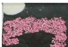
Jさかえ 「西山公園の桜」