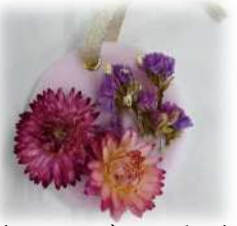
(ラベンダーの香り)