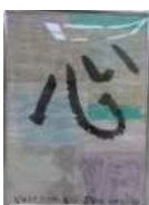
Jふれあい鞍ヶ池 「こころをひとつに」