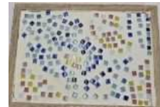
Jふれあい 「キラキラ☆タイル」