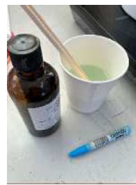
溶かしたワックスに クレヨンで色付け& アロマオイルで香り づけ