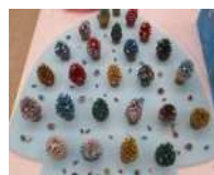
Jたかおか 「ひもりツリーの森」