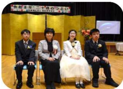
理事長と一緒に記念撮影