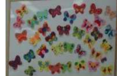
Jえかく・かずえ 「蝶の世界」