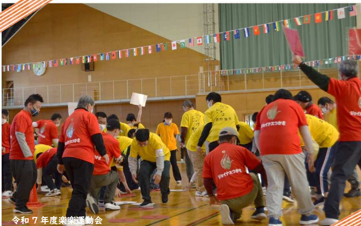
令和7年度楽楽運動会

発行 社会福祉法人豊田市育成会 〒471-0831 豊田市司町3丁目6番地1 TEL 0565-77-5611 FAX 0565-77-3557 E-mail t-ikuseikai@hm.aitai.ne.jp URL https://t-ikuseikai.jp/