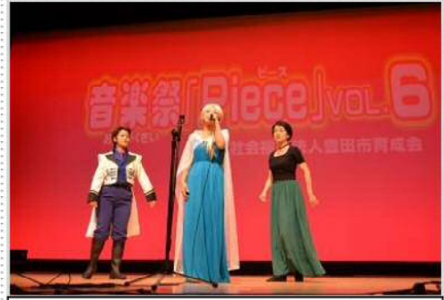
今回はアナと雪の女王で出演！ ぼっし〜ず☆