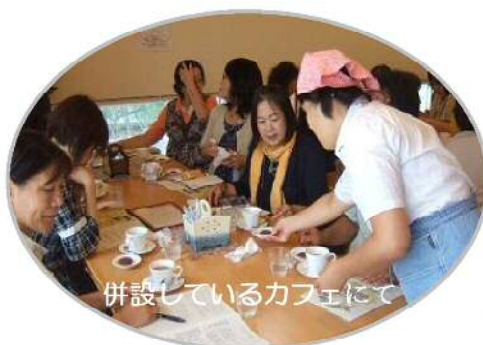
併設しているカフェにて