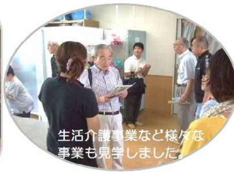
生活介護事業など様々な事業も見学しました。