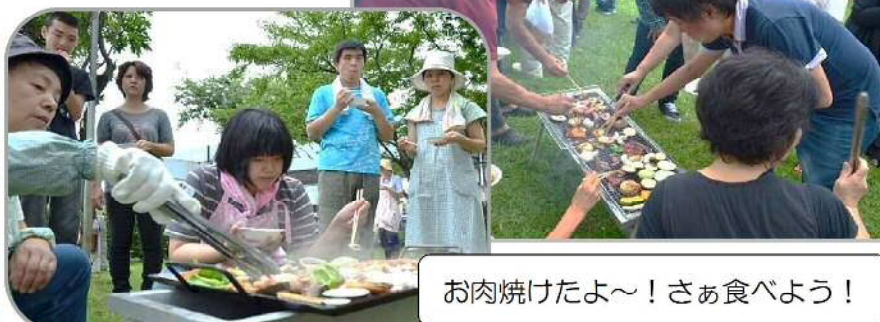
お肉焼けたよ～! さぁ食べよう!