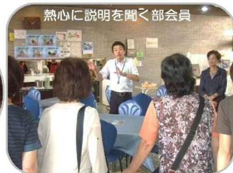
熱心に説明を聞く部会員