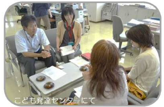
こども発達センターにて