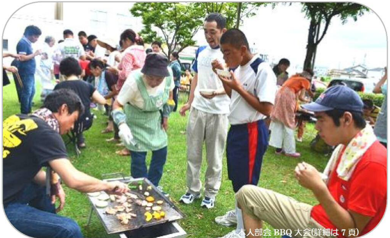
本人部会 BBQ 大会(詳細は7頁)