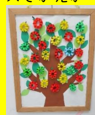
RTS (Jたかおか) 「アップルツリー」