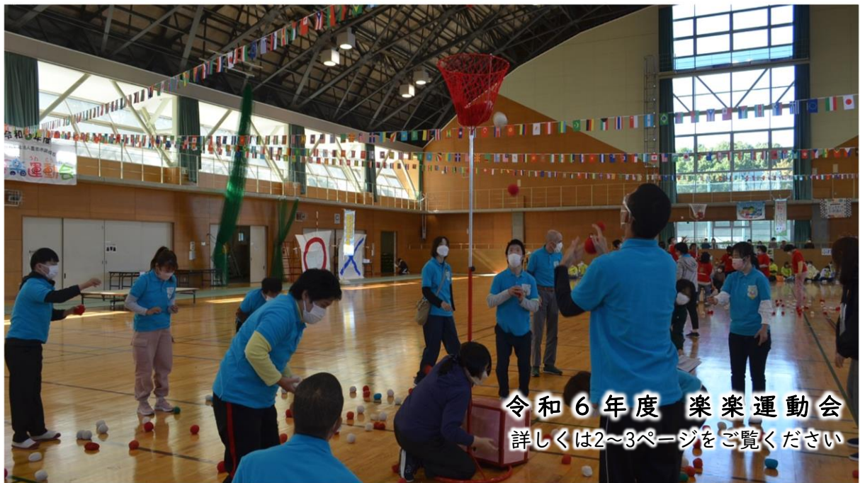
令和 6 年度 楽楽運動会 詳しくは2～3ページをご覧ください