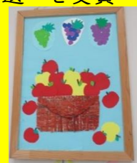
A & K (Jたかおか) 「アップルバスケット」