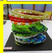
ジョイナスふれあい 「鞍ヶ池公園 「つなぐ」