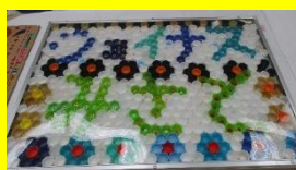
ジョイナスみさと 「花のみさと」