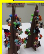
ジョイナスふれあい 「カラフルツインツリー」