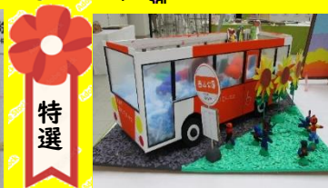
ジョイナスさかえ 「おいでんバスに乗って行こまい!」