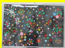
ジョイナス えかく・かずえ 「花火」