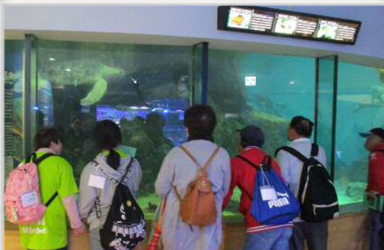
平成 29 年度 ハレハレハイキング （名古屋港水族館）