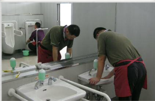
就労事業（請負・自主製品・施設外など）