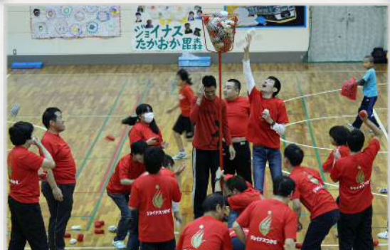
平成 29 年度 衆衆運動会