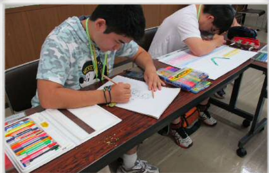
平成 29 年度 青年学級（コース別・3 種）